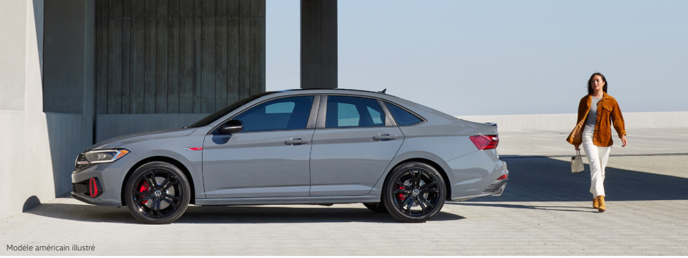
Modèle américain illustré