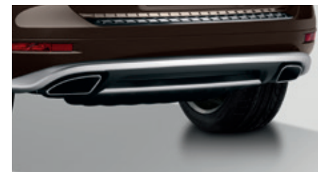
Applique arrière chromée