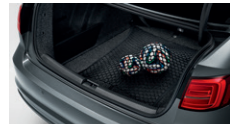
Filet de retenue