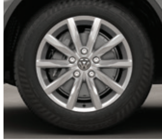
Roue en alliage « Arica » de 18 po SL