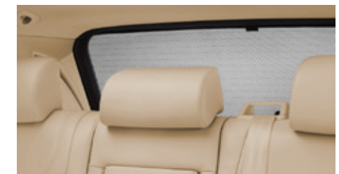
Écran solaire pour fenêtres de hayon et latérales