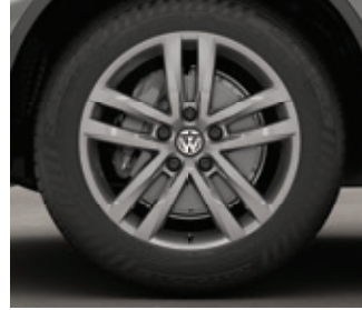
Roue en alliage « Salvador » de 19 po HL