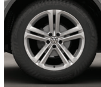
Roue en alliage « Mallory » de 20 po Ensemble R-Line HL/EL