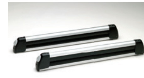
Traverses de porte-équipement de base et support à skis/planches à neige