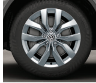
Roue en alliage « Masafi » de 20 po EL