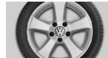
Roue d'hiver « Sima » de 17 po